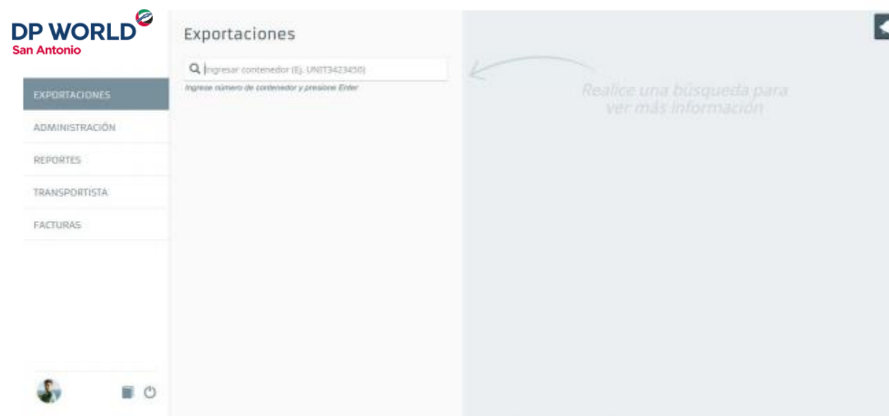
Pantalla principal de la aplicación, módulo exportaciones

Al iniciar sesión en la Web transaccional, se encontrará con la siguiente pantalla. Por defecto el módulo inicial es el de importaciones.