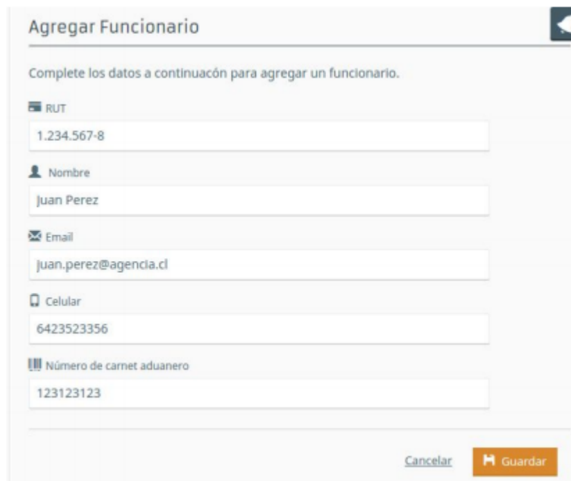
Creación de un nuevo funcionario

La aplicación incluye un módulo de administración para que las Agencias de Aduana puedan auto gestionar sus funcionarios. Para crear un funcionario, presione el botón "Nuevo" que se encuentra sobre el buscador y complete el formulario que aparecerá sobre su derecha: